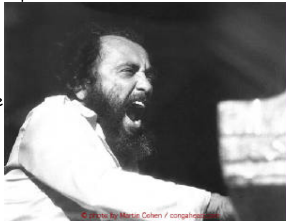
Eddie Palmieri

El 12 de Septiembre de 1988 es un día triste en la vida de Eddie pues fallece su hermano Charlie a quien consideró su guía, por esa razón el 6 de Noviembre del mismo año se le rindió un gran homenaje. En los años siguientes el trabajo de Eddie se ve influenciado por el Latin Jazz, debido a la gran